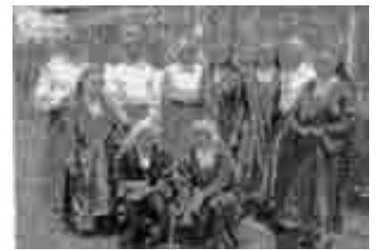
Les Carmelites del Portal Nou - Valls